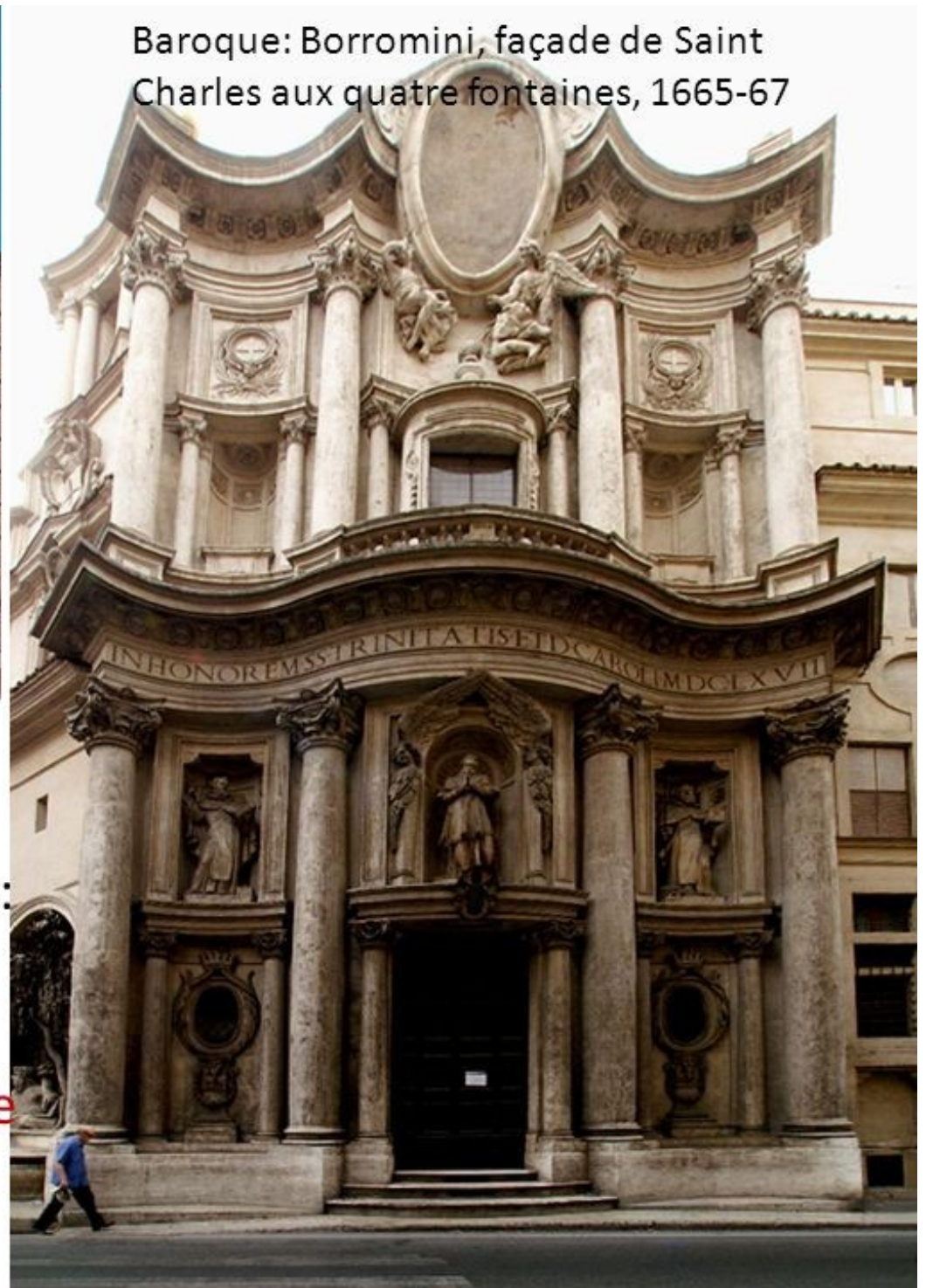
Baroque: Borromini, façade de Saint Charles aux quatre fontaines, 1665-67